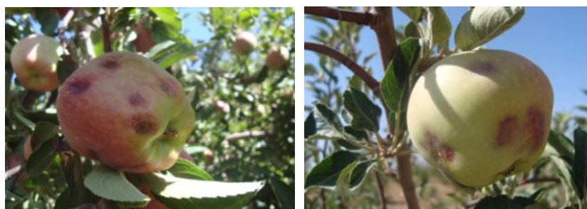
شکل ۳- علائم اختلالات کلسیمی شبیه خسارت سن‌های Pentatomidae روی رقم دلشز