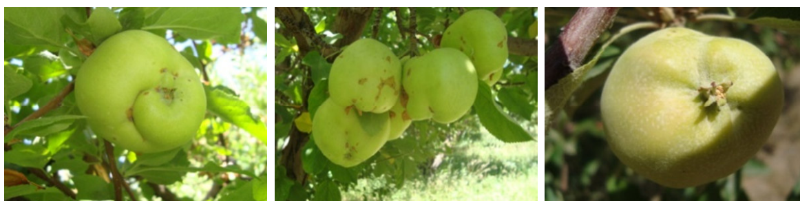
شکل ۲- علائم خسارت شدید سنک‌های Miridae و بروز عارضه صورت‌گره‌ای

بدشکلی میوه‌ها شده بود. در صورت افزایش جمعیت این سنک و سایر گونه‌های Miridae شدت خسارت افزایش یافته و میوه دچار بدشکلی شدید می‌گردد که اصطلاحاً عارضه صورت‌گره‌ای نام دارد (شکل ۲). در باغ‌های سیب به‌ویژه در منطقه حنا نوعی علائم شبیه خسارت سن‌های Pentatomidae دیده شد (شکل ۳). این علائم به‌طور عمومی روی اکثر درختان رد دلشز بازدید شده مشهود بود، در حالی که، در این باغ‌ها تعداد بسیار معدودی از سن‌های Pentatomidae جمع‌آوری گردید. خسارت این سن‌ها با اختلالات کلسیمی