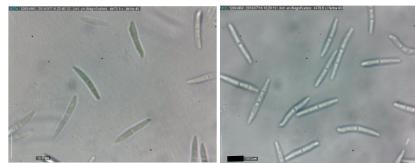
شکل ۳- نمای میکروسکوپی پیکنیدیوسپورهای قارچ

Fig. 2. Mycelium and pycnidiospores on YSA media respectively