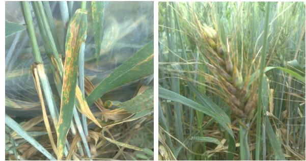
شکل ۱- علائم آلودگی خوشه و برگ‌های گندم به Phaeosphaeria

بود. حداقل ۵۰ عدد از هر یک از اندام‌های قارچی (پیکنیدیوم و پیکنیدیوسپور) در چند نمونه میکروسکوپی بررسی و اندازه‌گیری شدند (شکل ۲ و ۳). شناسایی و تعیین گونه بر اساس منابع معتبر قارچ شناسی انجام شد (Cunfer and Ueng, 1999; Shoemaker and Babcock, 1989).