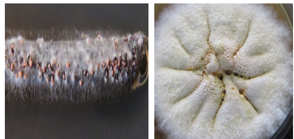
شکل ۲- به ترتیب پرگنه و پیکنیدیوسپورهای نارنجی شکل قارچ

Fig. 1. The symptom of infected ears and leaves to Phaeosphaeria nodorum in the field