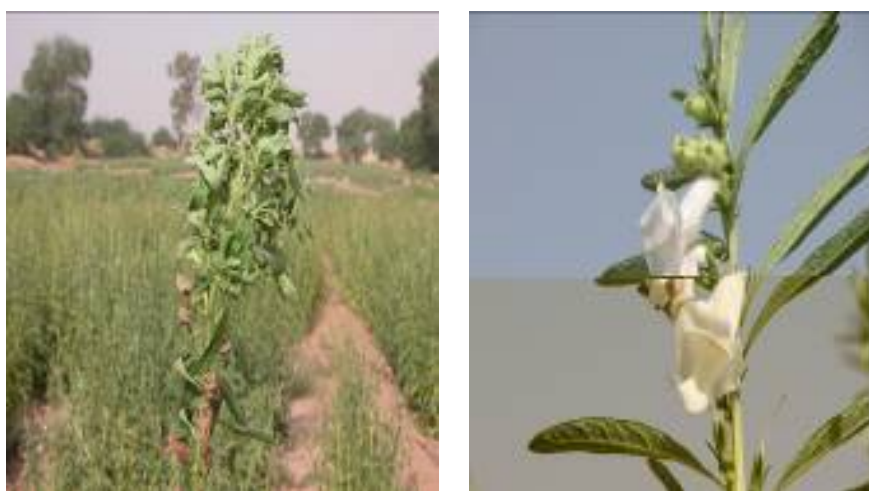
شکل ۱- گل سبز، علامت اصلی بیماری فیلودی (سمت چپ) و بوته سالم (سمت راست) Fig. 1- Green flowering, the important symptom of phyllody (Left), Health plant (Right)

است (Deeley et al. , 1979). تشخیص با این محلول رنگی اختصاصی نیست و فیتوپلاسمها را تفکیک نمی کند.