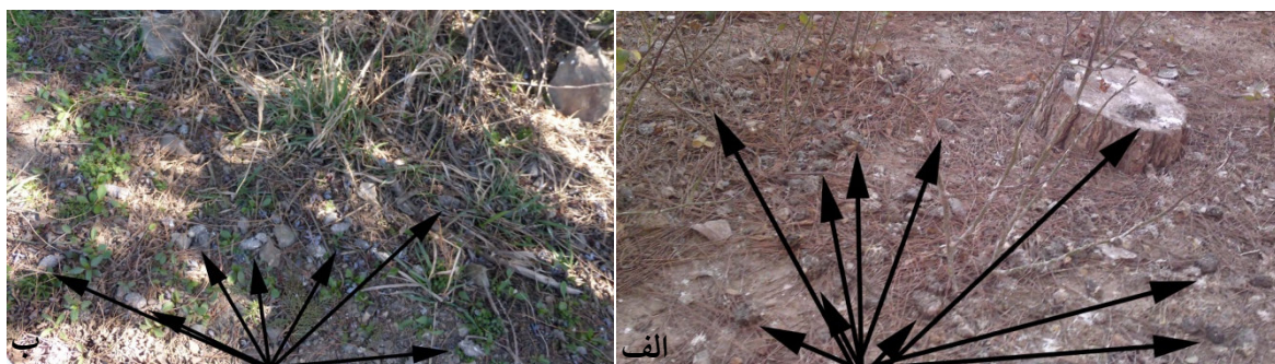
شکل ۱- آثار ریمه‌ها و فضله‌ها، الف) زیر درختان کاج در کرج، ب) زیر درختان سرو در همدان