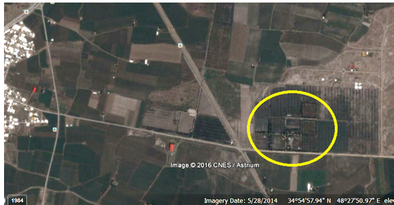
شکل ۴- موقعیت محل تجمع جغد گوش دراز و مزارع اطراف آن، شهر بهار، استان همدان