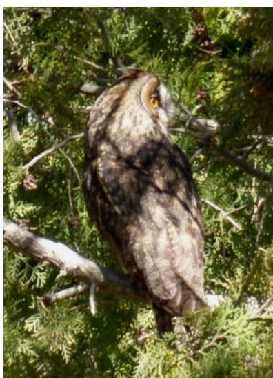
شکل ۳- یک جغد گوش دراز روی درختان سرو در بهار، استان همدان