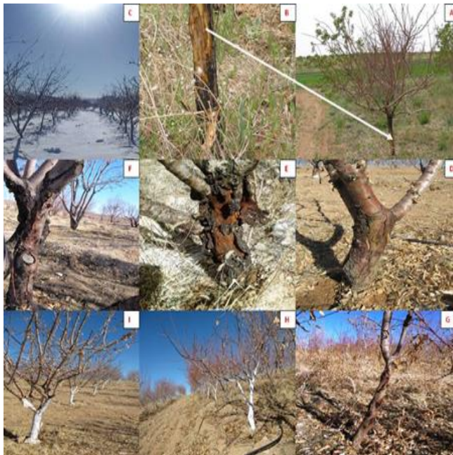
شکل ۱- علائم آفتاب سوختگی زمستانه درختان بادام و هلو.

بود (جدول‌های ۲ و ۳). همچنین در درختان تیمار شده با رنگ سفید، میزان جداسازی باکتری بیمارگر و شدت علائم کمتر از درختان بدون تیمار بود (جدول‌های ۴ و ۵).