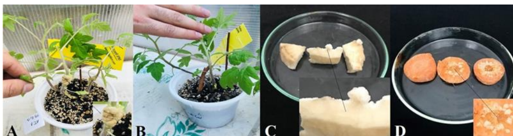
شکل ۲- آزمون اثبات بیماری‌زایی سویه Agrobacterium tumefaciens AT-N21. تشکیل گال روی طوقه گیاهچه گوجه‌فرنگی (A)، عدم تشکیل گال روی تیمار شاهد (B)، تشکیل کالوس روی قطعات شلغم (C) و هویج (D)، در هر تشنگ پتری، قطعه سمت چپ شاهد می‌باشد.

Fig 2. Pathogenicity test of Agrobacterium tumefaciens AT-N21. Gall formation on crown of tomato seedling (A), no gall on negative control (B), callus formation on slices of turnip (C) and carrot (D), in each Petri dish, the left slice is negative control.