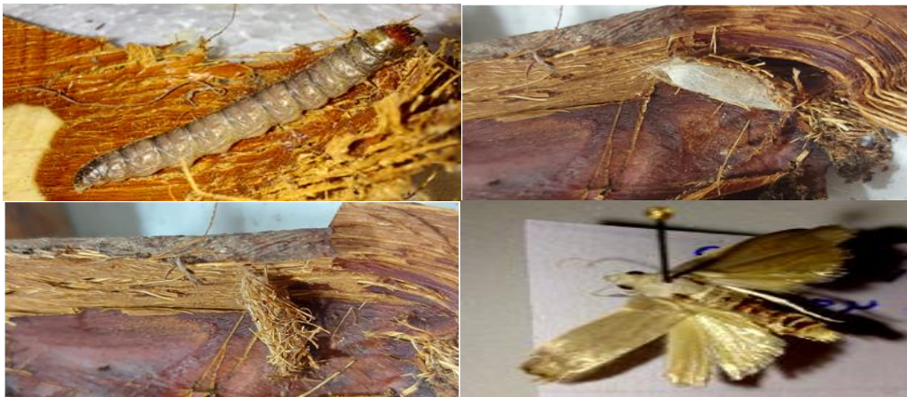
شکل ۱- لارو، شفیره و بالغ کرم گرده خوار خرما A. sabella پرورش یافته روی پاجوش خرما. Fig.1. Larvae, pupa and adult stages of the greater date moth, A. sabella on offshoot of date palm

در بررسی‌های انجام شده تراکم زیادی از لاروهای سن سه و چهار زمستان گذران کرم گرده خوار در طی ماه‌های آذر و دی ۱۳۹۹، روی پاجوش‌های نخل خرما رقم برحی جمع‌آوری شد (شکل ۱). فعالیت لاروها در دستجات ۴ تا ۵ تایی روی بافت چوبی کرب‌های داخلی قابل مشاهده و خسارت لاروها با تغذیه از بافت چوبی پاجوش‌ها قابل مشاهده بود. بر خلاف انتظار رفتار انفرادی لاروها روی غلاف گرده، لاروها رفتار دسته جمعی و تجمعی داشته و روی یک کرب ۲ تا ۳ لارو همزمان مشاهده شد. در ابتدا، تغذیه لاروها سبب ایجاد خراش‌هایی بر روی بافت چوبی تازه قاعده کرب‌ها شده اما با افزایش رشد و تغذیه، کانال‌هایی توسط لاروها در امتداد کرب‌ها ایجاد و سبب خروج شیره گیاه شد. حضور شیره گیاه، فضولات لاروی و تارهای تنیده شده در آلودگی زیاد سبب خشک شدن کرب‌های جوان پاجوش گردید (شکل ۲).